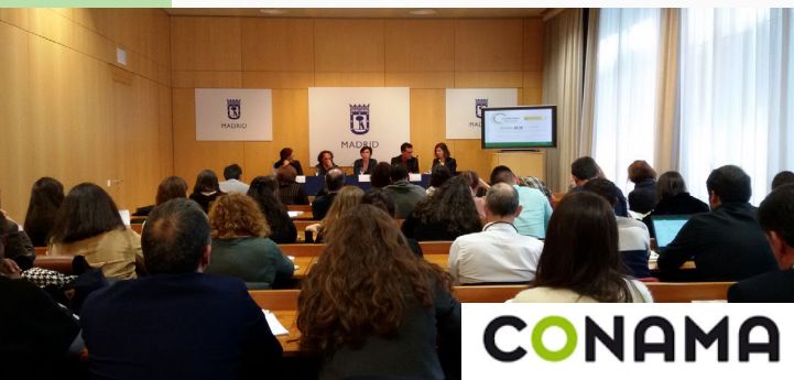
FORO ACCIÓN SECTORIAL POR EL CLIMA e INNOVACIÓN Y CIENCIA SECTORIAL CLIMATE ACTION and INNOVATION & SCIENCE FORUM